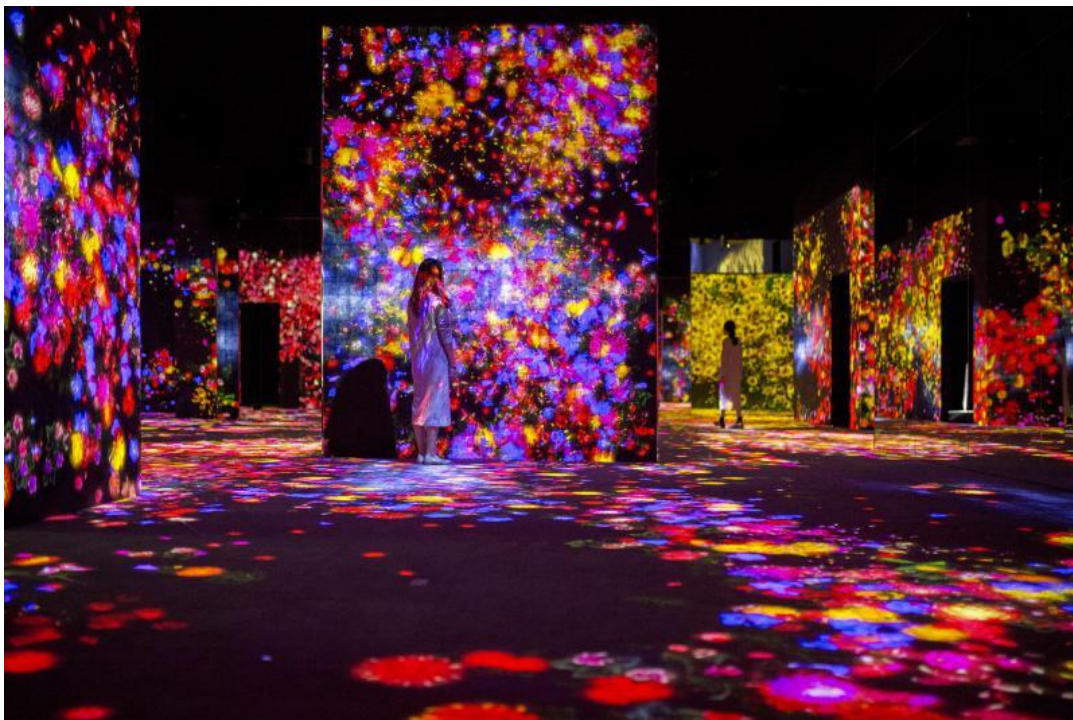
《花与人的森林: 迷失、沉浸与重生-蜂巢结构》